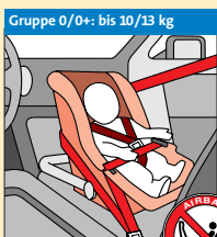
Gruppe 0/0+: bis 10/13 kg Babyschale ②