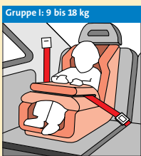
Gruppe I: 9 bis 18 kg Fangkörper-System ⑤