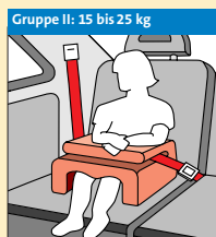
Gruppe II: 15 bis 25 kg Fangkörper-System ⑤