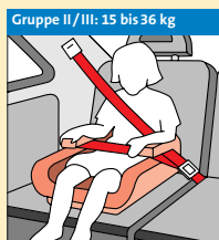
Gruppe II/III: 15 bis 36 kg Sitzerhöhung ohne Schlaf- stütze ②