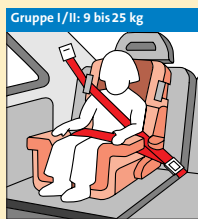
Gruppe I/II: 9 bis 25 kg 3-Punkt-Gurt-System ②