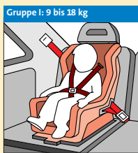
Gruppe I: 9 bis 18 kg 5-Punkt-Gurt-System ④