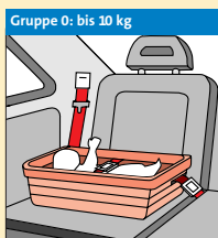
Gruppe 0: bis 10 kg Babywanne / Kinderwagen- aufsatz ①